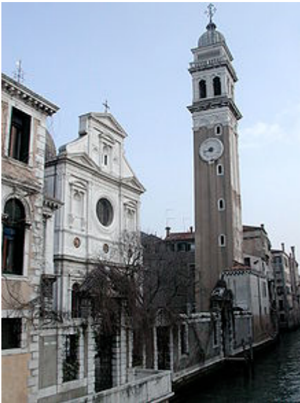
San Giorgio die Greci