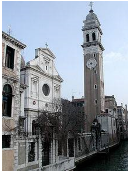
San Giorgio dei Greci