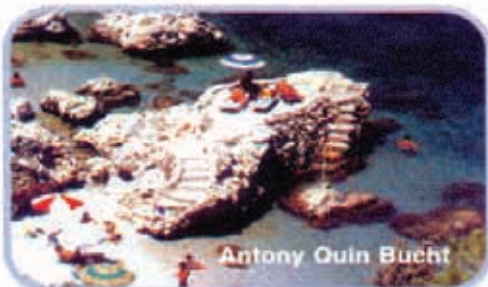
Anthony Quinn Bucht