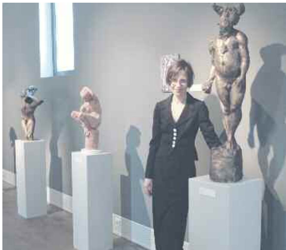
BERLIN - Von Athanasia Theel