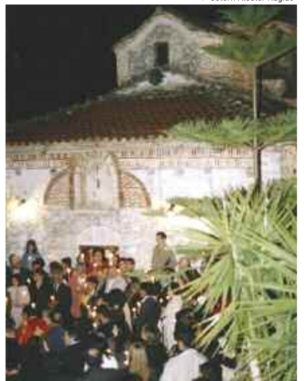
▼ Ostern Kloster Ragiuo

Laute Stimmen und Arbeitsgeräusche aus dem Innenhof lassen Großes ahnen. Die Vorbereitungen für die Feier der Wiederauferstehung scheinen im vollen Gange zu sein.