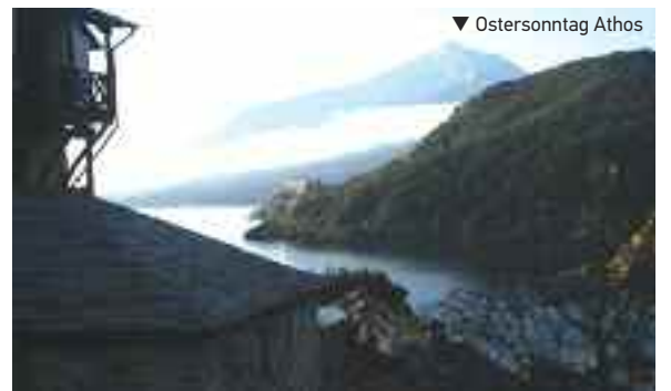
▼ Ostersonntag Athos

Etwas steif erklimmen die Besucher die Stufen zur Trapeza. Aha, nicht nur mir fiel einiges schwer. Wie gewohnt, hat an den Tischen alles bereits seinen Platz – Essen, Geschirr, Becher, Wein und Wasser. Es folgt der große Auftritt des noch jungen Abtes. Vorweg ein inbrünstiger Sänger, danach zwei Medailonträger, dann der Abt mit langer roter Schleppe, die von zwei Mönchen gehalten wird. Nach einigen Worten des Abtes ertönt das befreiende Glockensignal. Es signalisiert den Beginn des Essens und damit auch des Fastenbrechens. Mit Kartoffeln und Karotten gedünstetes Fischfilet in schmackhafter Soße, Lauchsuppe, Käse und Sahnetörtchen, auch der fast schwarze Rotwein mündet morgens um sechs Uhr vorzüglich.