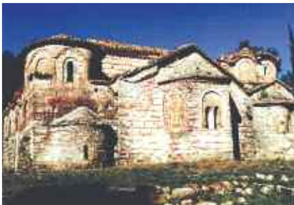
Turkopaloukon ▲ Acheron ▼

Glikli ist dann nur Zwischenstation auf unserem Weg zum Ionischen Meer. Die Strabe führt an den Resten einer frühchristlichen Basilika vorbei, deren Besonderheit eine begehbbare Säule darstellt. Von Glikli fahren wir nach