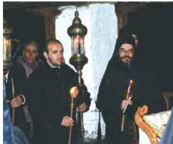
▲ Ostern Athos

von allen Pilgern gerne mit nach Hause genommen. Naja, zur Not müssen es die wenigen roten und weißen Nelken tun, welche mir im Körbchen präsentiert werden.