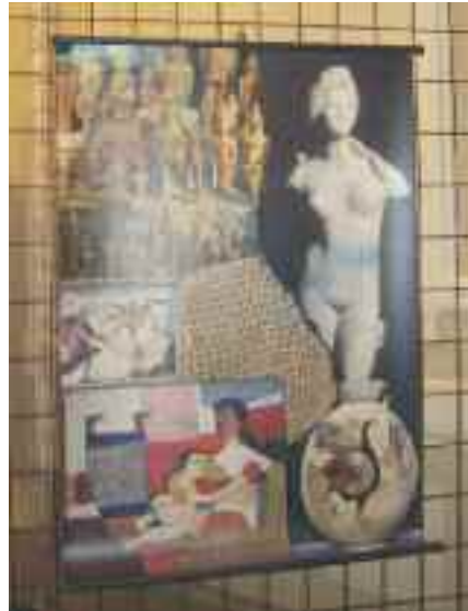
Φωτογραφική έκθεση για την Κύπρο

Την επόμενη μέρα, ο κ. Λυσιώτης είχε συνάντηση με τον Πρόεδρο του Εμπορικού και Βιομηχανικού Επιμελητηρίου της Λυών κ. Philippe Grillo καθώς η Λυών είναι η πρωτεύουσα της ευρύτερης περιοχής Ροδανού –