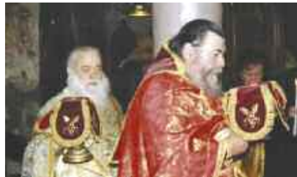
▲ Ostern Kloster Ragiuo

Die riesige, lichtdurchflutete Kirche der Skite schlägt immer den Atem. Nicht nur wegen der Abmessungen, sie ist eine der größten des Athos, um vieles mehr wegen ihres Glanzes. Die mächtige, mehrere Stockwerke hohe Ikonostase, Bildwände, Leuchter, alles mit Gold überzogen. Ähnlichen Goldglanz kenne ich sonst nur aus der im vierten Stock gelegenen Doppelkirche des Russenklusters Agiou Panteleimonos.