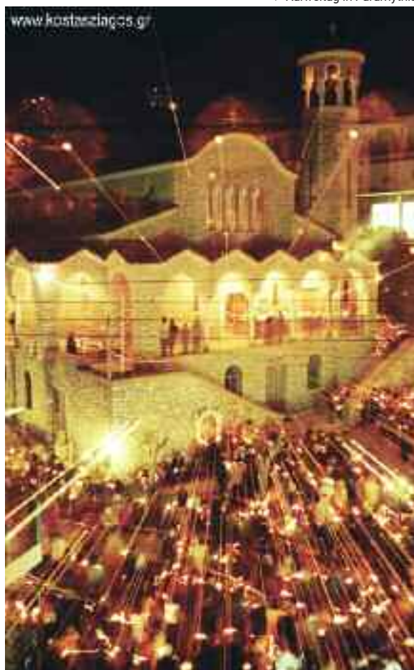
▼ Karfreitag in Paramythia

Heute wird er gekreuzigt. Monoton und eindringlich tönt seit dem Abend des Donnerstag die Totenglocke. Auch den ganzen Freitag wird der mahnende Klang begleiten. Heute