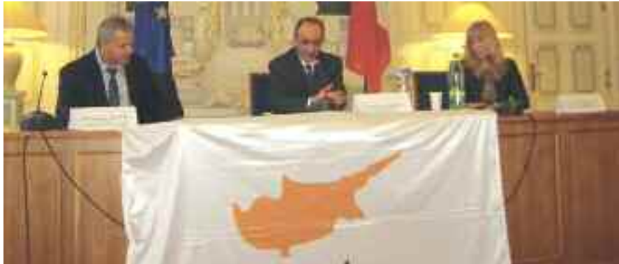
Στο Δημαρχείο της Λυών, στη μέση ο κ. Μάριος Λυσιώτης Πρέσβης της Κύπρου στο Παρίσι

Στα πλαίσια των πολιτιστικών δραστηριοτήτων της Πρεσβείας της Κύπρου στο Παρίσι και των επαφών με αξιωματούχους των περιφερειών, ο Πρέσβης κ. Μάριος Λυσιώτης πραγματοποίησε μια διήμερη επίσκεψη στην όμορφη κόρη του Ροδανού, τη Λυών από 4-5 Απριλίου.